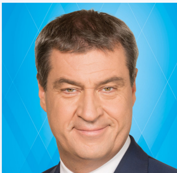
Dr. Markus Söder, MdL Bayerischer Ministerpräsident