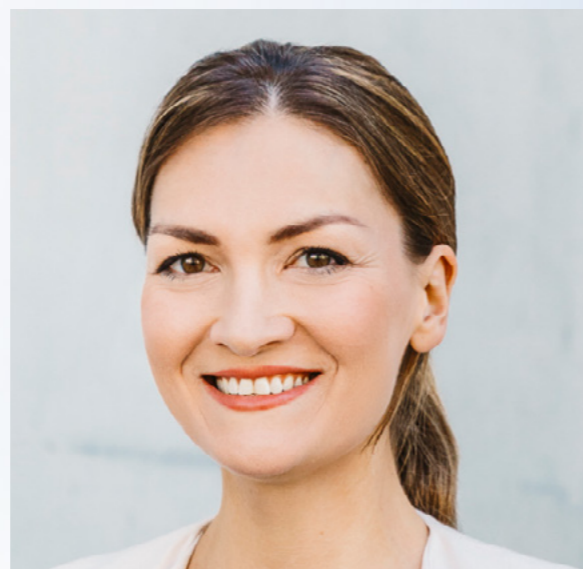
Judith Gerlach, MdL Bayerische Staatsministerin für Digitales